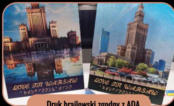
Druk brajlowski zgodny z ADA