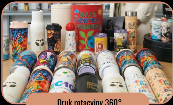
Druk rotacyjny 360°