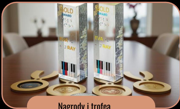
Nagrody i trofea